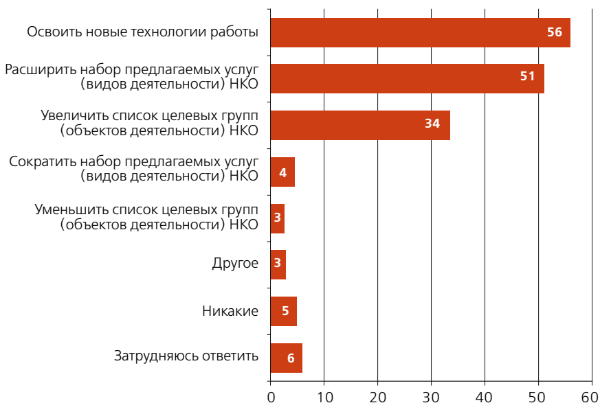
Рисунок 3. Какие действия ваша организация намерена предпринять в первую очередь для продвижения себя на «рынке», в том сегменте сектора НКО, который она занимает?

5. Что касается видов наиболее востребованных услуг, то и НКО, и компании прогнозируют рост запроса на консультации по защите прав и интересов (в первую очередь социальных и экономических прав), профессиональной подготовке, трудоустройству, развитию малого бизнеса. В то же время запрос на программы, касающиеся улучшения качества жизни (защита окружающей среды, досуг и т.п.), уходят в нижнюю часть списка в ответах НКО, что вполне закономерно для кризисного времени, но остаются в средней части списка, по мнению компаний.