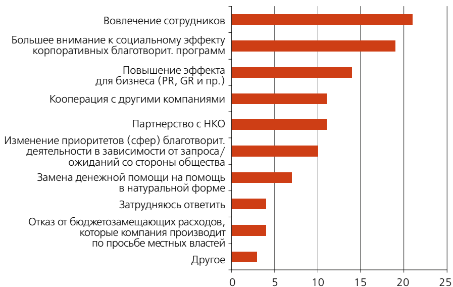
Рисунок 6. Какие действия намерена предпринять ваша компания в отношении своей благотворительной деятельности в условиях кризиса?

«С одной стороны, и это позитивный момент, исследование показало, что компании понимают: благотворительность – это способ продемонстрировать устойчивость бизнеса. Все задумались об эффективности, и это тоже хорошо. Но, с другой стороны, в этой бочке меда есть и ложка дегтя: только треть компаний имеет партнерство с НКО, которые занимаются администрированием их проектов; компании фактически не ждут повышения роли аутсорсинга в администрировании своих благотворительных инициатив. По-моему, это азбука корпоративного управления: когда надо снижать издержки, экономить – тогда начинают по-максимуму выводить определенную деятельность на аутсорсинг. Но не выводят, всякий раз рассчитывают на личную инициативу, на свои силы и не считают, что какая-то профессиональная помощь может повысить эффективность, что довольно-таки удивительно».