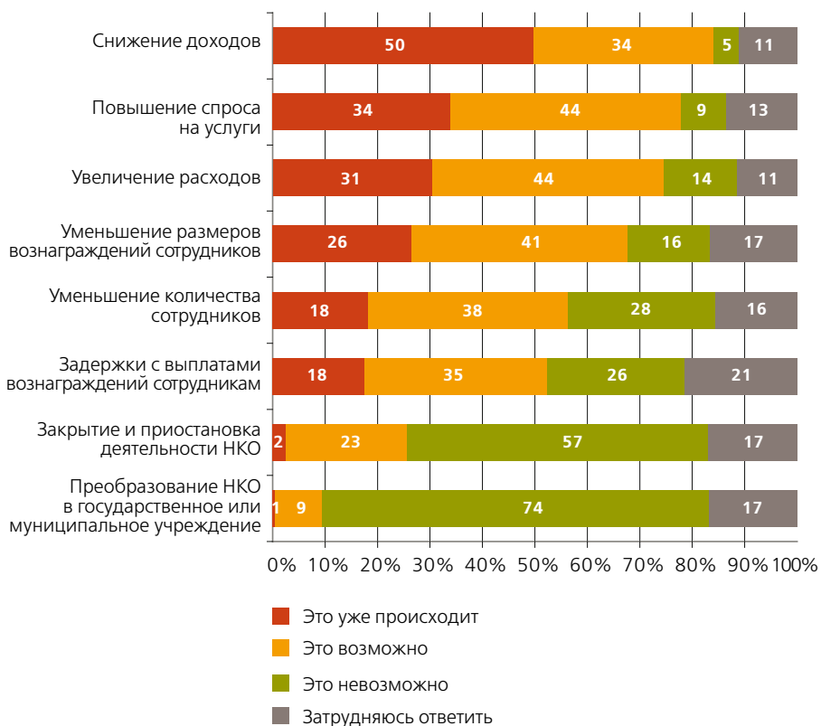
Рисунок 1. Какова вероятность того, что в ближайший год в вашей некоммерческой организации будут происходить следующие события?

3. Наиболее подвержены кризису с позиций НКО оказались поступления от коммерческих компаний (их сокращение отмечают 65% НКО, получающих или получавших средства из данного источника), региональных и муниципальных бюджетов (54% и 52% соответственно), доходы от предпринимательской деятельности (52%). Самыми стабильными оказались поступления из федерального бюджета и взносы от учредителей, членов: более 50% опрошенных отмечают, что они остались на прежнем уровне или даже возросли.