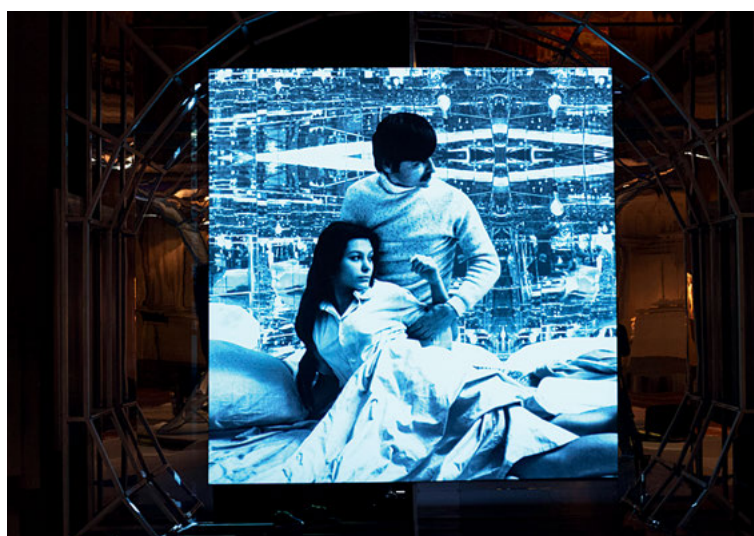
Выставка посвящена знаменитому фильму Андрея Тарковского и наследию советских художников-нонконформистов