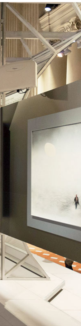
В 2018 году во Флоренции стартовал международный проект Музея AZ «Новый полет на Солярис» (совместно с Фондом Франно Дзеффирелли)