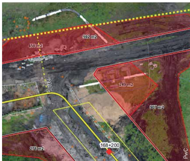
Проверка соблюдения строительных планов и контроль за ходом выполнения строительных работ

наблюдение за территорией и патрулирование в рамках плановых и внеплановых полетов.