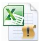
PwC Отчет по зарплатным данным 2020